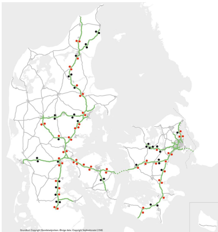
Figur 1. Tællinger på 90 motorvejsrastepladser på hverdage. Sort: Ledig kapacitet. Rød: Ingen ledig kapacitet